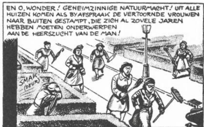
De vrouwen komen in opstand tegen het voetbal gewapend met deegrollers, bezems en mattenkloppers. 105