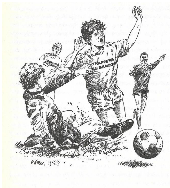
Jelle wordt gemeen onderuit gehaald door Beer 130