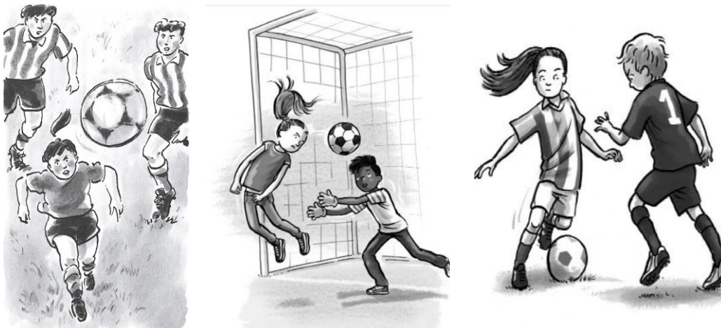
De meiden laten zien meer snelheid, inzicht en techniek te hebben dan de jongens 142

Toch is in de boeken ook een dominante kant en rol van de vrouwelijke personages waar te nemen. Hun zelfvertrouwen en assertiviteit groeit in de boeken. Zij laten meerdere keren op het veld zien gelijk of beter te zijn dan hun mannelijke tegenstanders. De meiden worden beschreven als snel, gevaarlijk, slim, stoer en niet-kleinzerig. Meerdere malen zijn zij de tegenstander te snel en te slim af en laten zij de jongens ‘kansloos’ achter zich. 140 Ook nemen de vrouwen andere rollen aan dan in de fictie uit de voorgaande periodes. De ondersteunende rol van vrouwen is minder aanwezig en vrouwen worden vaker in leidersrollen geplaatst. Zo wordt Stella uit De voetbalster uiteindelijk captain van haar gemengde team en in Het geheim van de voetbalmeiden krijgen de meiden een vrouwelijke coach. 141 Deze rolverschuiving is ook te zien in de rollen die de jongens in deze boeken aannemen. Vaker zijn jongens nu in een ondersteunende rol als fan en moedigen ze de meiden aan.