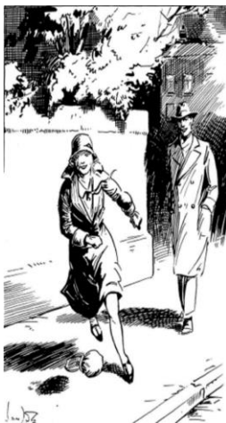
Mieke voetbalt met haar tasje. 76

Hieruit blijkt duidelijk dat zij alleen een mannelijke voetballer voor zich kunnen zien en dat vrouwen niet worden geaccepteerd op het voetbalveld. Hierbij wordt er een duidelijk contrast tussen het vrouwelijke en het atletische geschetst. Toch voetbalt Mieke in het geheim ook af en toe met andere dames. Eén keer laat zij dit ook zien aan hoofdpersoon Wijn. Ze blijkt snel en tweebenig te zijn en imponeert Wijn hiermee. Ze geeft hem zelfs enkele tips over hoe hij een betere voetballer zou kunnen zijn. 75 De lezer kan zich identificeren met Mieke en zich op deze manier voorstellen dat een vrouw goed kan voetballen.