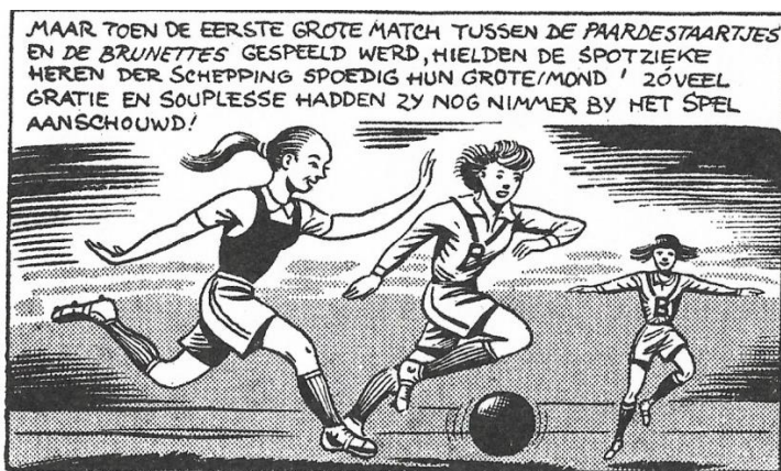
De vrouwen voetballen met gratie en souplesse. 106